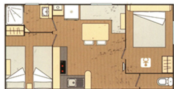
Fidjy-lofty + terrasse couverte