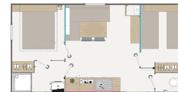
Lodge-4 + terrasse couverte et fermée (Plan non contractuel)