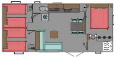
Evolution + terrasse couverte